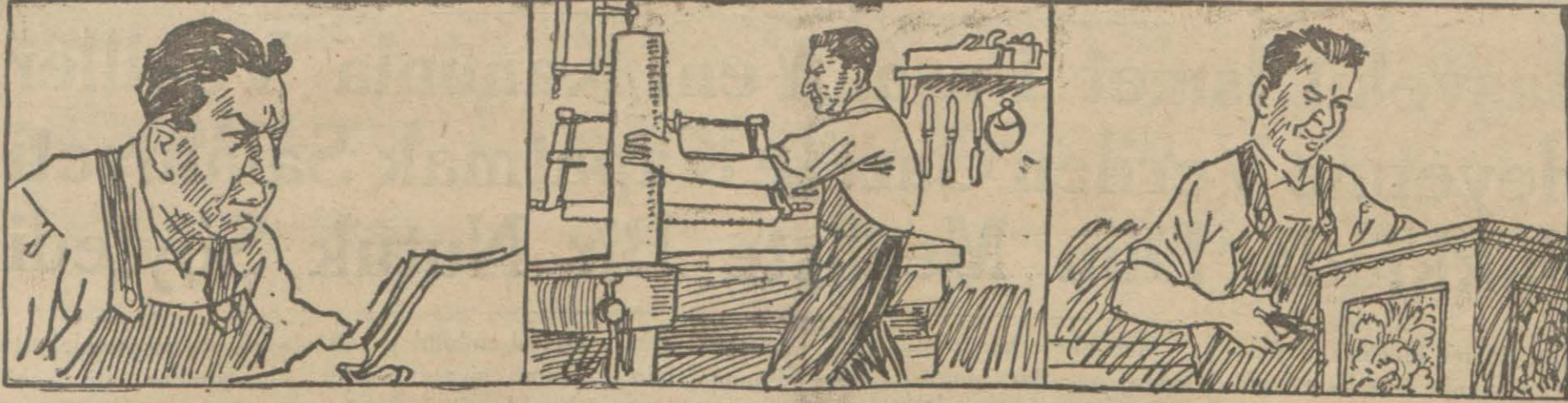
1 — İnsanın en büyük meziyeti çalışmak kabiliyetini haiz olması