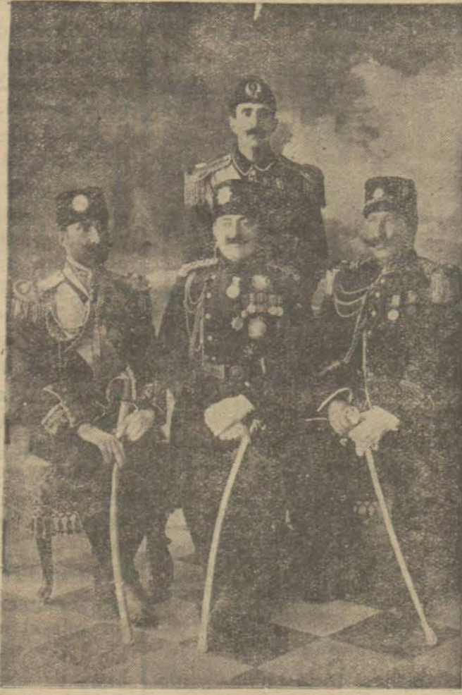
Ortada Amanullah Han, sağda Mahmut Han (Türk), solda Nadir han (Bugünkü Kral)