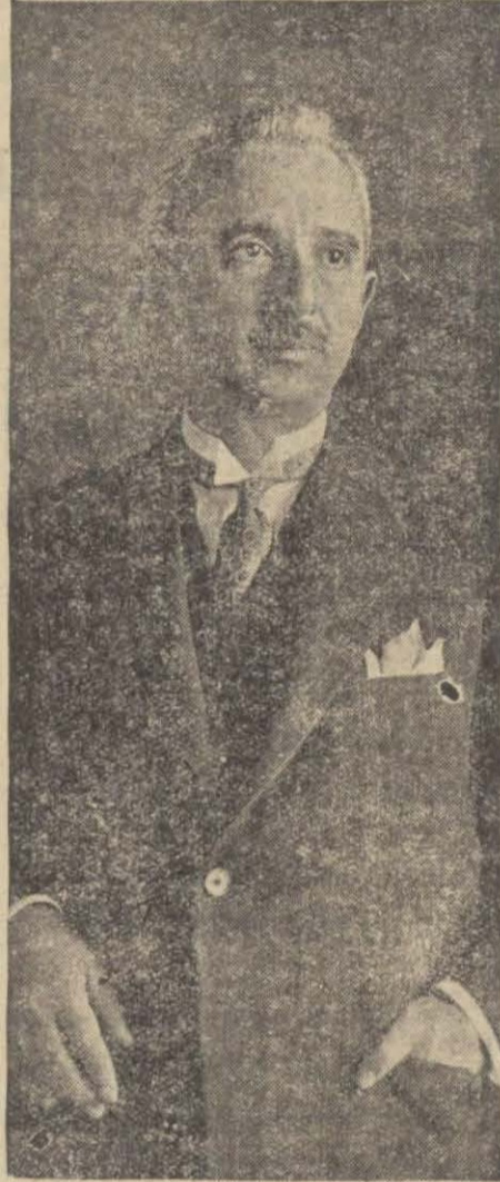
Dün mecliste matbuat hakkında bir nutuk söylediği Başvekil İsmet Paşa

Memlekete her müşkülü halenden ne kadar muğlak olursa olsun millî meseleleri nihayet durulmuş bir su gibi bir istikamete tevcih edebilen yekâne kuvvet Büyük Millet Meclisidir. Onun için sözlerimin hu-