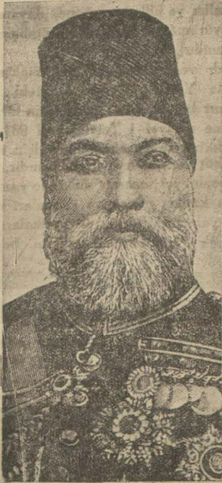
Her selâmlıkta Abdülhamidin karşısına oturtuğu Gazi Osman Paşa

— Cemil Paşayı beyenmesine ne dersin?.. Mutlaka bir meseleden dolayı âmaline hizmet etmemiş olacak. Boynumu bükerek cevap verdim: